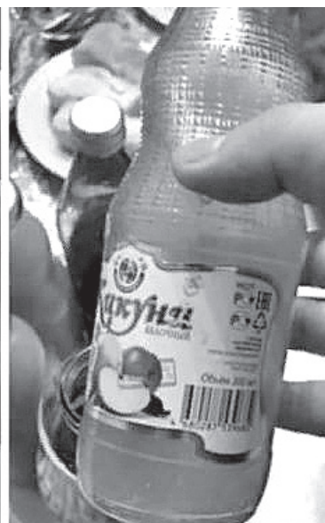
ПРЕСС-СЛУЖБА РОСПОТРЕБНАДЗОРА ПО РД