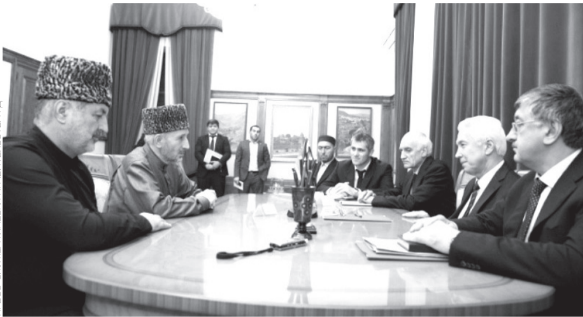
ПРЕСС-СЛУЖБА ГЛАВЫ И ПРАВИТЕЛЬСТВА РД

Врио главы Дагестана встретился с лидерами трёх конфессий