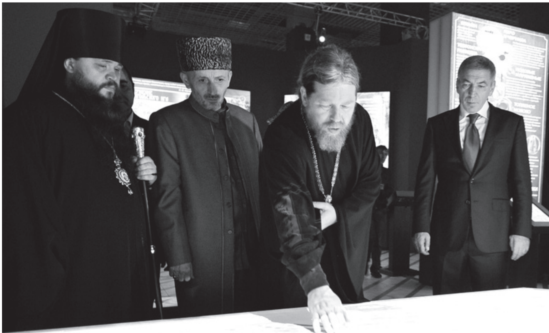
Высокие гости рассматривают экспозицию

В Махачкале открылся интерактивный музей