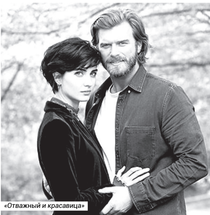
«Отважный и красавица»