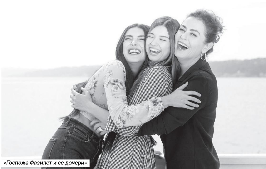
«Госпожа Фазилет и её дочери»

Зачастую сценарий к фильмам диктует сама жизнь.