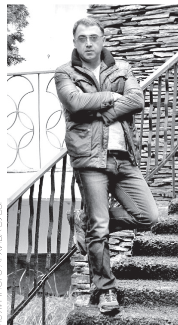
ИЗ ЛИЧНОГО АРХИВА БУБЫ