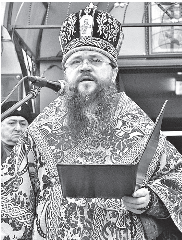
СЕРГЕЙ РАСУЛОВ / NEWSTEAM