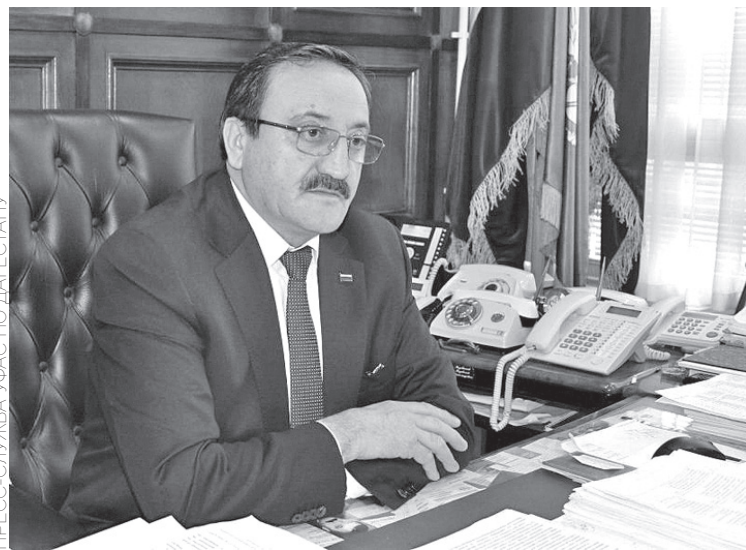
ПРЕСС-СЛУЖБА УФАС ПО ДАГЕСТАНУ

За нарушения в сфере госзакупок управление вынесло