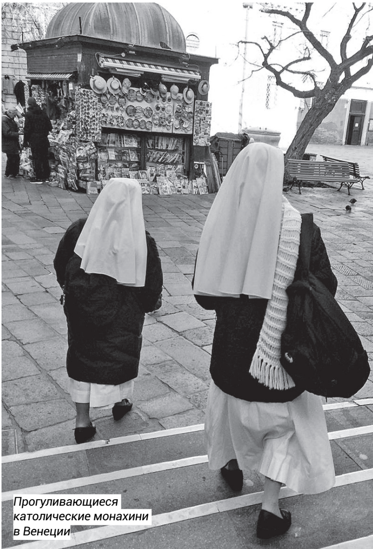
Прогуливающиеся католические монахини в Венеции