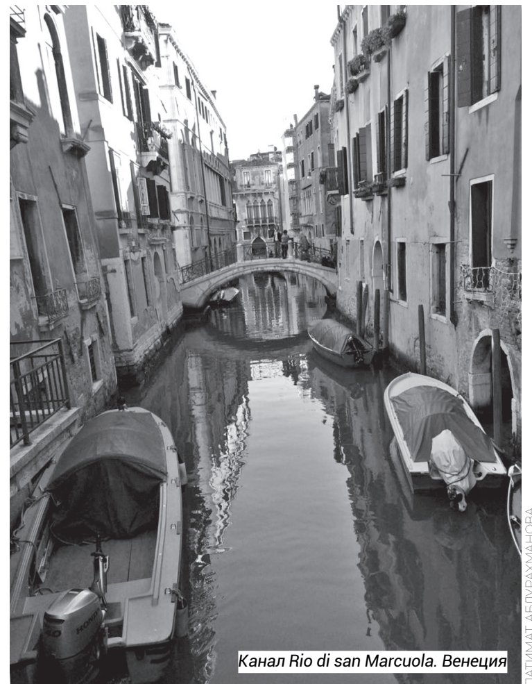
Канал Rio di san Marcuola. Венеция

На карте отелей Booking трехзвездочные номера начинаются от двух тысяч в сутки, но их содержание не всегда для комфортного пребывания. Поищите варианты на Airbnb, возможно, по этой же цене вы найдете неплохую студию со всеми удобствами, и, к тому же, расположенную в неплохом районе. Плюсы жилья из Airbnb – колорит итальянской обстановки и декора, а также наличие контакта с хозяином дома, который раскроет еще больше лайфхаков.