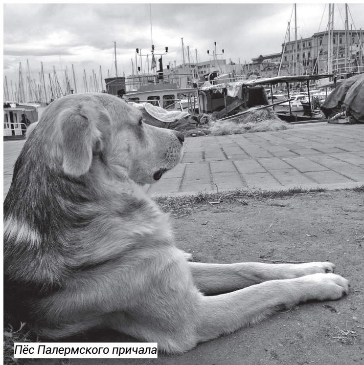
Пёс Палермского причала

Две собаки – это среднее число питомцев в одном доме. Однако собаки их очень дис-