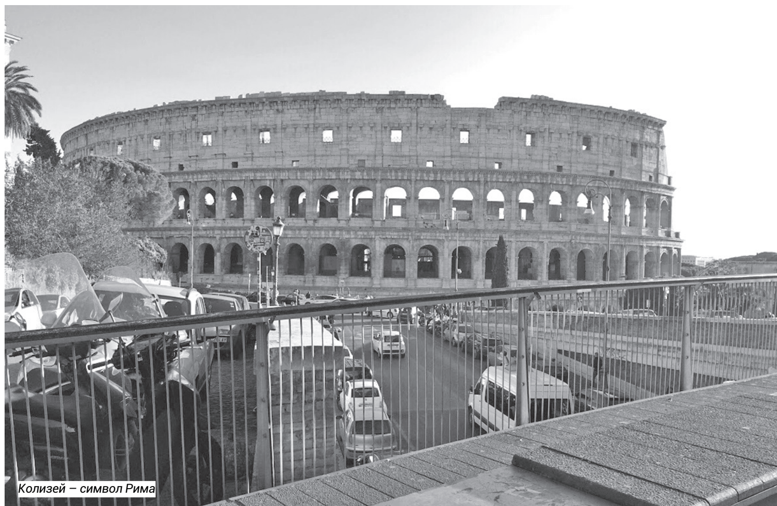
Колизей – символ Рима

Кавказские женщины относятся с интересом к тем самым «итальянским брендам» или «итальянской моде», однако, к их разочарованию, жительницы Рима, Флоренции или Неаполя выглядят совершенно иначе. Они не носят золотых аксессуаров и, тем более, страз (этим могут немного грешить сицилийки). Их стиль сдержанный, в нем преобладают элементы классической или базовой