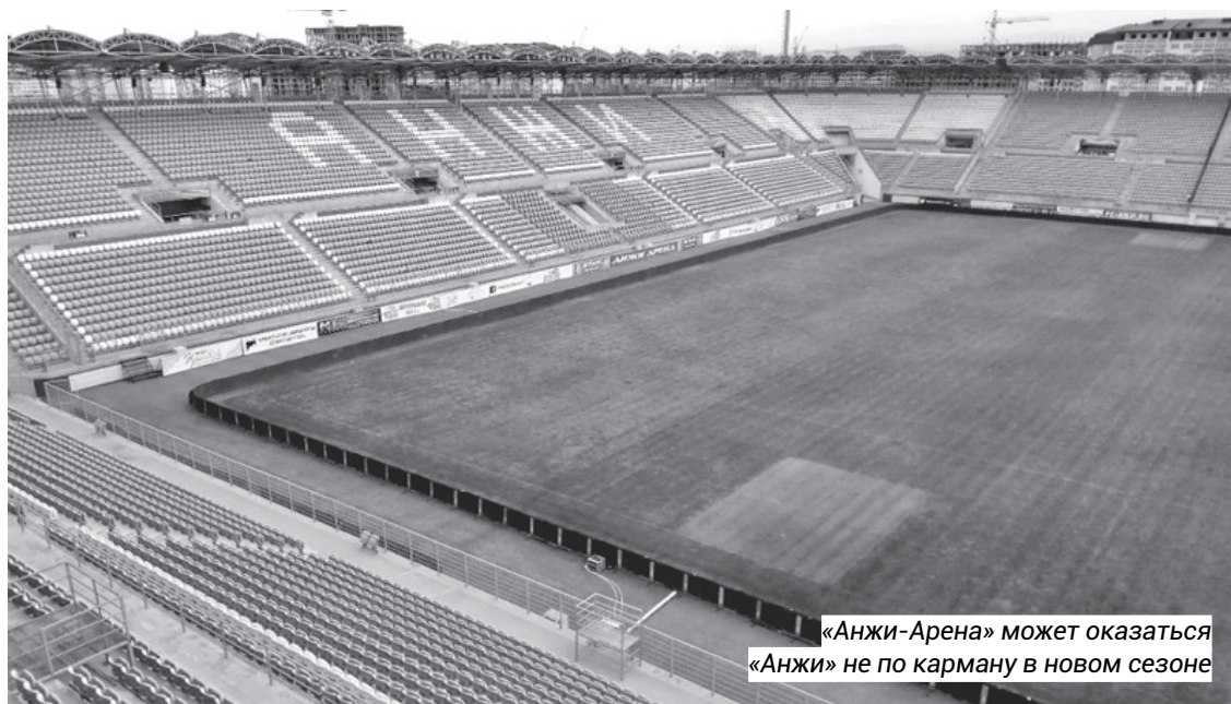
«Анжи-Арена» может оказаться «Анжи» не по карману в новом сезоне

Сейчас «Анжи» находится на предсезонном сборе в Кисловодске. Клубы премьер-лиги в России сборы не проводят – это почти аксиома. Тут элементарно не найти хороших спарринг-партнеров, потому что европейские клубы тоже не тренируются в России, готовясь к новому сезону. Самое популярное направление летом у них – Австрия. Но у «Анжи» на нее, по всей видимости, денег нет. Поэтому Кисловодск и соперники по контрольным матчам в лице клубов зоны «Юг» второго дивизиона. С «Чайкой» из села Песчанокосское махачкалинцы сыграют сегодня, 29 июня, с нальчикским «Спартаком» – в последний день сбора, 4 июля.