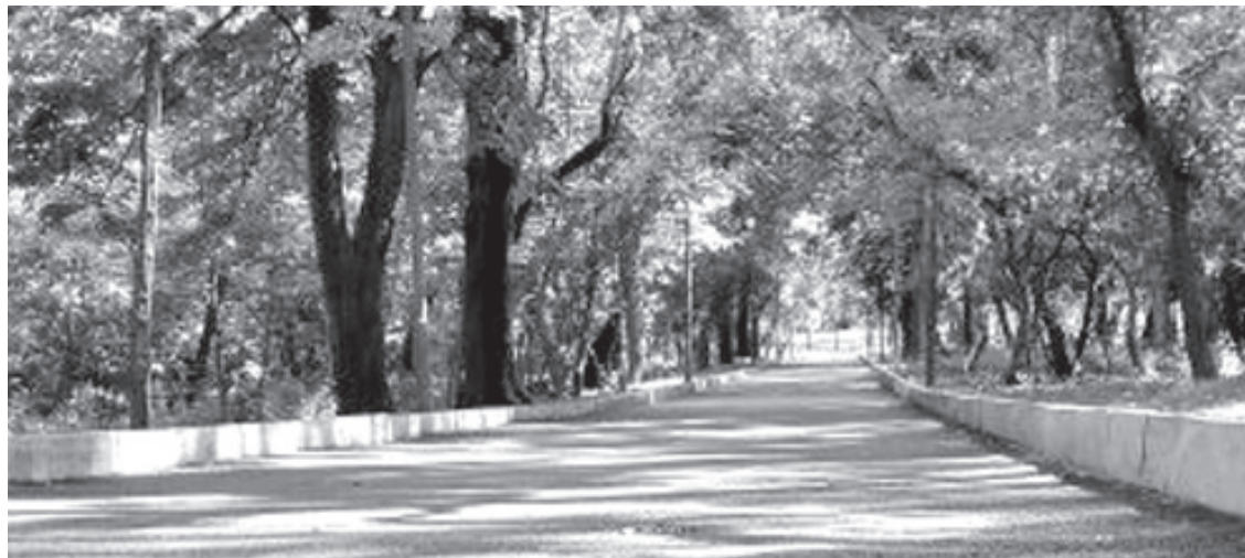
После сильного дождя здесь хорошо пойдет торговля надувными лодками. Такими аквапарковыми желобами изрезана вдоль и поперек вся некогда «дикая» часть парка