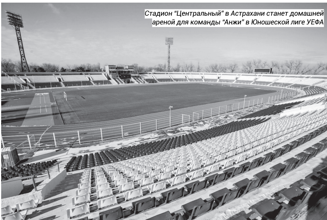
Стадион «Центральный» в Астрахани станет домашней ареной для команды «Анжи» в Юношеской лиге УЕФА