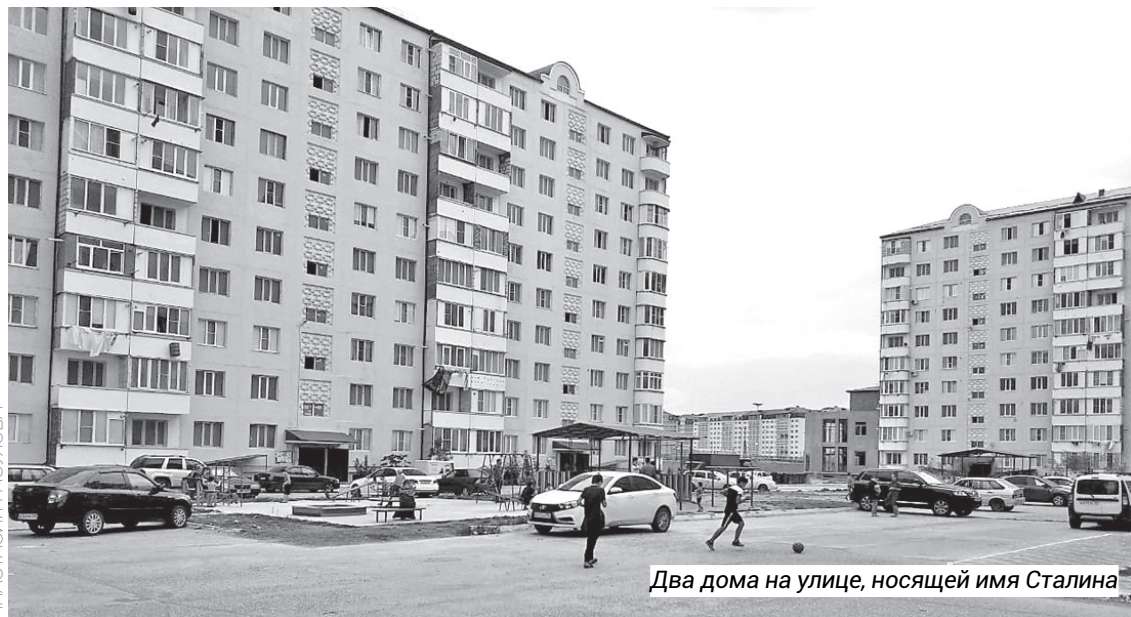
Два дома на улице, носящей имя Сталина

Дворцом спорта и молодежи им. Али Алиева. Упоминания названия улицы Сталина (к которой относятся только эти два дома — 1 и 1 «а») появились уже весной 2016 года. В то же время неизвестно, когда было принято решение о присвоении улице этого имени. В соцсетях обсуждалась версия, что присвоение имени Сталина улице было чьей-то частной инициативой. Во всяком случае, отсутствие каких-либо официальных документов на сайте городской администрации Каспийска дает основания предполагать, что речь идет о своего рода самозахвате, осуществленном почитателями вождя.