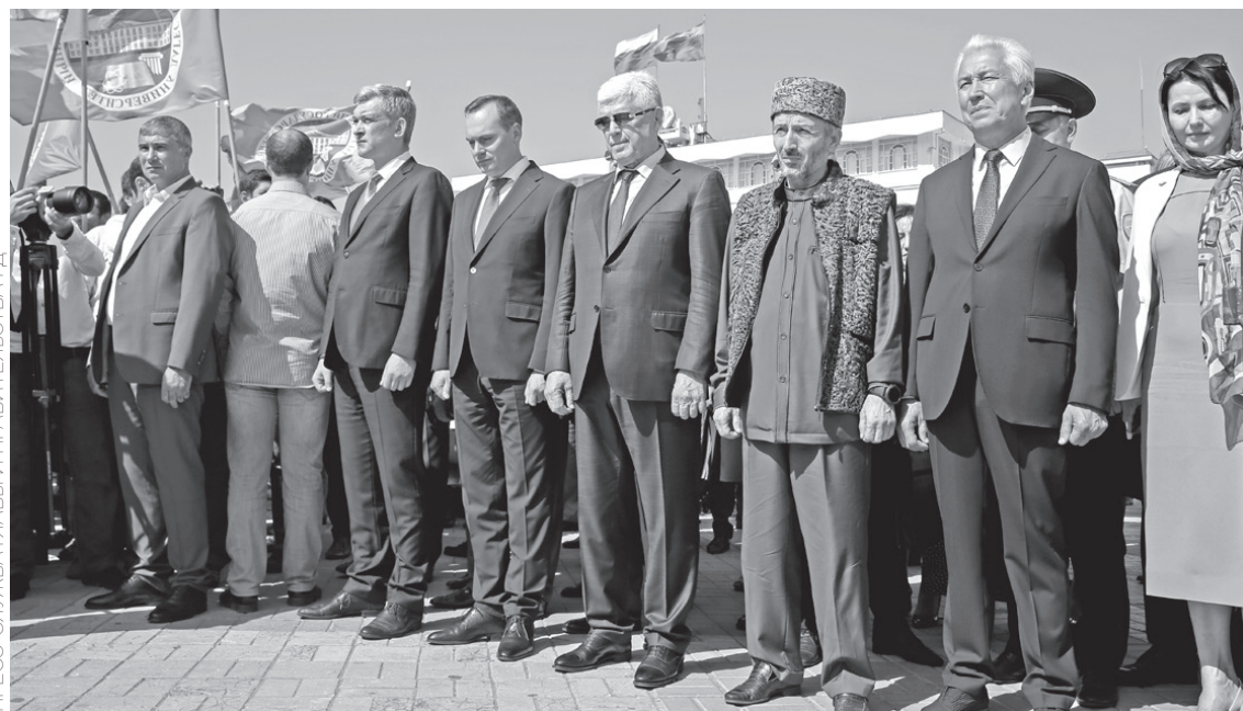
ПРЕСС-СЛУЖБА ГЛАВЫ И ПРАВИТЕЛЬСТВА РД

В мероприятиях участвовали все муниципалитеты республики