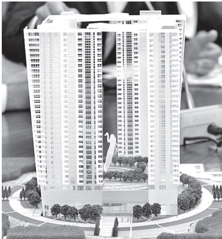
Первоначально проект жилого комплекса «Белые журавли» предусматривал строительство более тридцати этажей