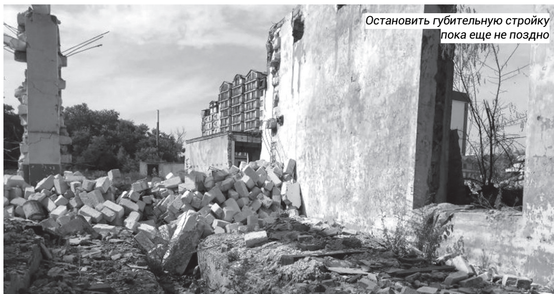
Остановить губительную стройку пока еще не поздно

«Лучших контролеров (чем местные жители. — «МД») качественного и эффективного использования средств не найти, — сказал Владимир Васильев, выступая на открытии Урбанистического форума в Махачкале. — Мы же понимаем, с какой точки стартуем: понятно, что архитектурный облик, состояние общественных пространств в городах и поселениях нашей республики пока еще далеки от пожеланий граждан. Я рассчитываю, что по итогам работы Урбанистического форума будут выработаны конкретные рекомендации, которые мы сможем вместе осуществить в плане практического применения. Обещаю, что вся наша работа будет проходить открыто, с привлечением широчайших слоев всего нашего общества».