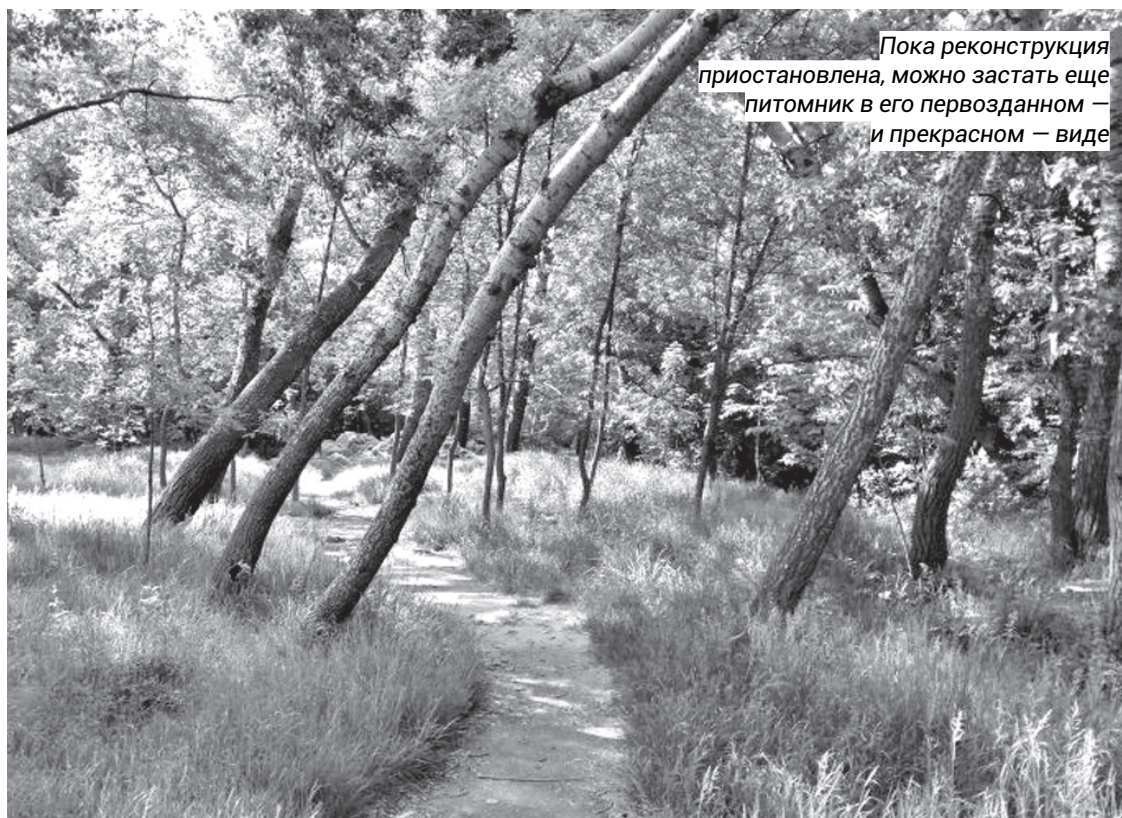
Пока реконструкция приостановлена, можно застать еще питомник в его первозданном — и прекрасном — виде

— Мы согласовали, что там, где были раньше протоптаны дорожки, будут новые благоустроенные. Но это асфальтирование мы не согласовывали, более того, я лично выступал против таких узлов и использования дорожного бордюра в парке. Когда строят дорогу, укладывают такой бордюр, он