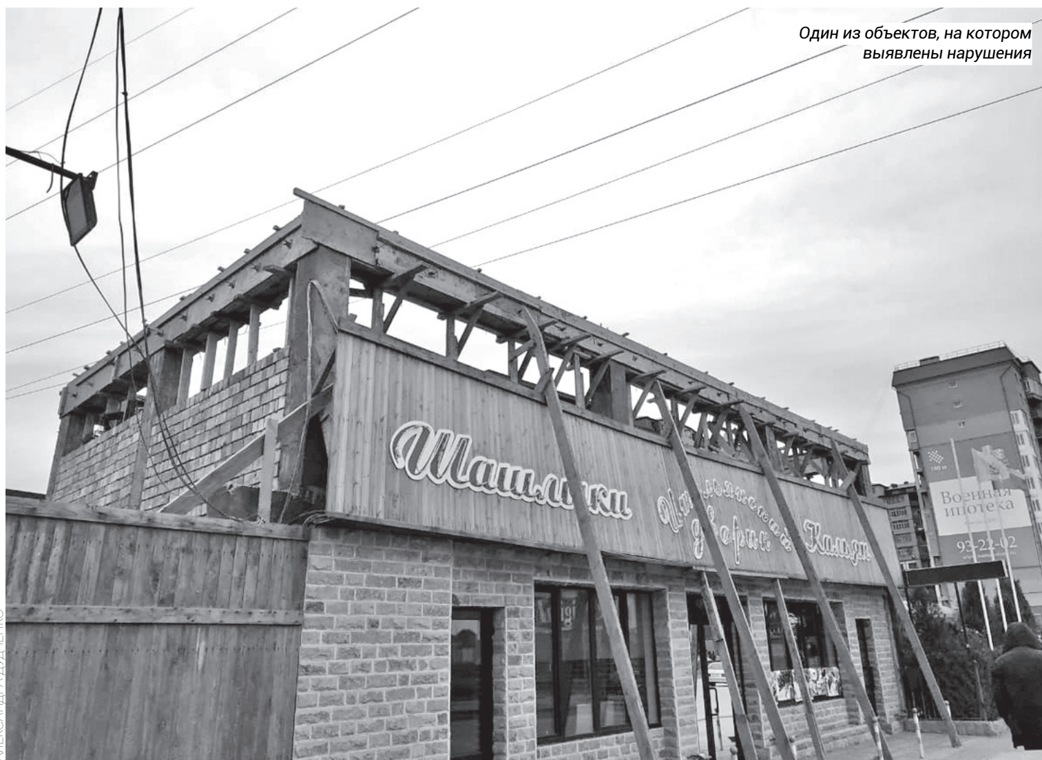
Один из объектов, на котором выявлены нарушения

«Провод от 35 киловольт падает на землю, он без защиты от однофазных коротких замыканий и не отключается мгновенно. Пока его отключит дежурный на подстанции, пройдет время, а за это время может произойти что угодно: