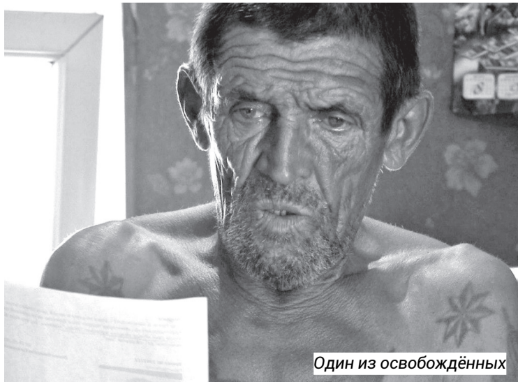
Один из освобождённых

Кирпичные заводы есть во всём Северном Кавказе, но лидеры по трудовому рабству – Дагестан, Чечня, Ставрополь, Калмыкия. В Дагестане в основном кирпичный посёлок на территории Каспия, в Карабудахкентском, Новолакском, Бабаюртовском, Тарумовском районах. 30 % – частники. Кочубейская зона, Тарумовский район и Южно-Сухокумск. Очень много кошар в Ногайском районе. В основном – север Дагестана и Каспийск.