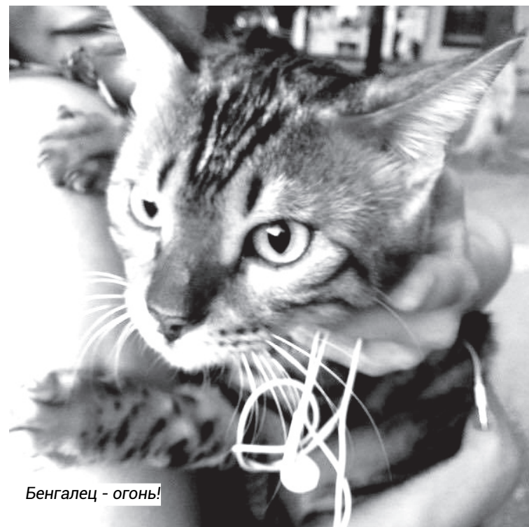
Бенгалец - огонь!

За всё время у меня был только один породистый кот, скорее даже метис. А болел как человек. Но гулял как кот. Два три дня мог не быть дома, а потом как ни в чем не бывало возвращаться. Однажды он заболел, лекарства и даже «Вискас» любимый не помогал, он постепенно превращался в человека. Ветеринар его так и не вылечил.