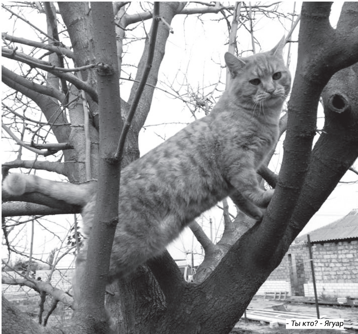
- Ты кто? - Ягуар

Кошка, если рожает, то четверых. Такая у нас была. Как будто знала, что нас четверо