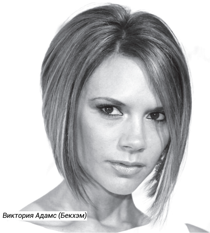
Виктория Адамс (Бекхэм)