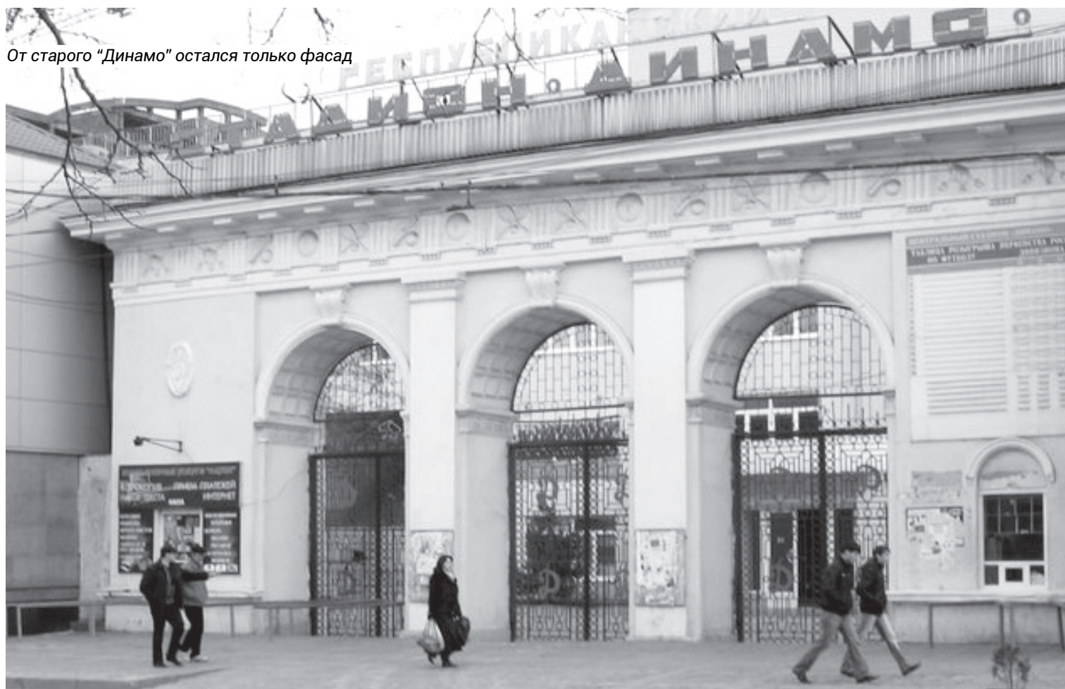
От старого «Динамо» остался только фасад

На том месте, где теперь расположена восточная трибуна, точнее, в том самом месте, где ныне пивной бар «Трибуна», находилось несколько площадок для игры в городки. У нас в городе была одна из самых сильных команд по этому виду спорта, как, впрочем, и по футболу на мотоциклах, мотокроссу и т.д. Сегодня, к сожалению, все эти виды спорта дагестанцами утрачены. Было также поле для игры в ручной мяч. Ближе к Котрова имелись небольшие спортивные сооружения, дотемна забитые молодежью. Никто ни за что не платил. Кто хотел, тот приходил,