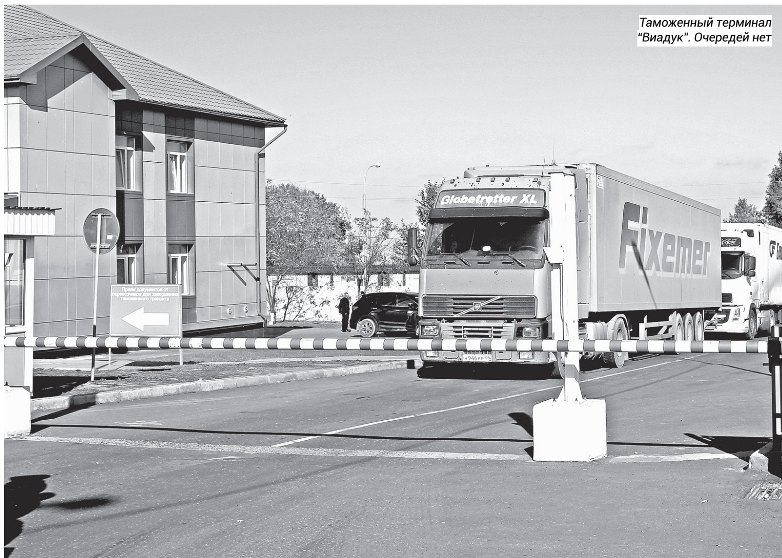
Таможенный терминал «Виадук». Очередей нет

Проверка была инициирована главой Дагестана Владимиром Васильевым после сообщений в СМИ о поборах с дальнобойщиков на таможенном посту «Яраг-Казмаляр». Кроме этого, дагестанские дальнобойщики собрались на российско-азер-