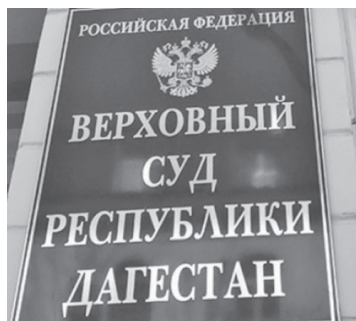
ВЕРХОВНЫЙ СУД РД