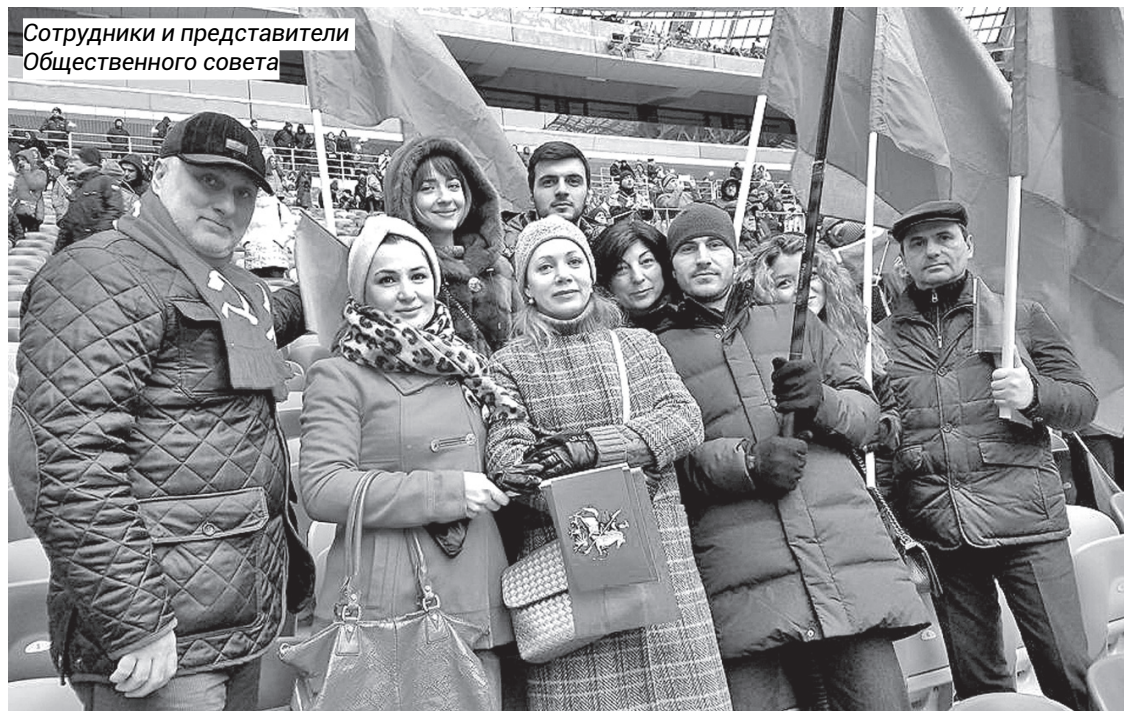
Сотрудники и представители Общественного совета

Рядом с нами пара средних лет. «Перестань жаловаться,