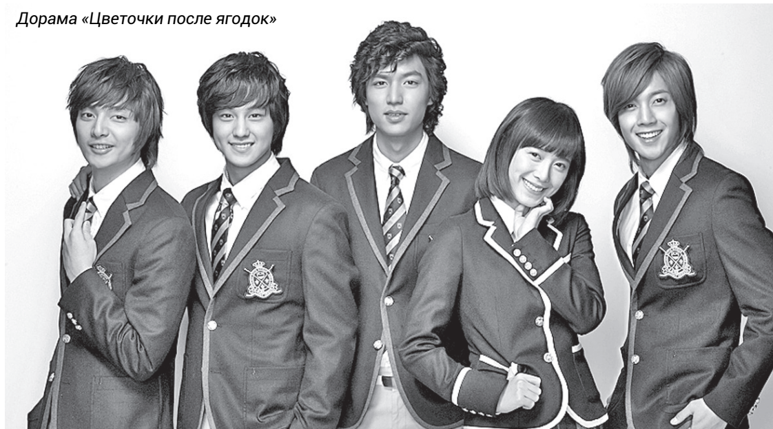
Дорама «Цветочки после ягодок»

Тот случай, когда название фильма уже определяет место и события. Кстати, есть ещё «Школа-2013» и 2015. Именно сериал «Школа-2017» признан лучшим среди самих школьников и бесконечных комментаторов - форумчан. В драме затронуты проблемы образования, тема дружбы учащихся, сложный возраст и история