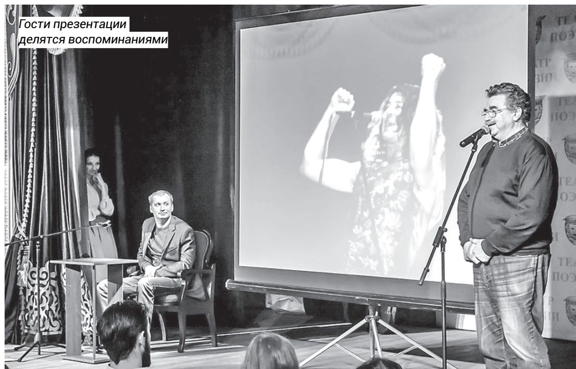
Гости презентации делятся воспоминаниями

«Тогда в Махачкале, на улице Дахадаева, появились обычные белые бумажки, на которых русским языком написано «Поет Ян Гиллан».