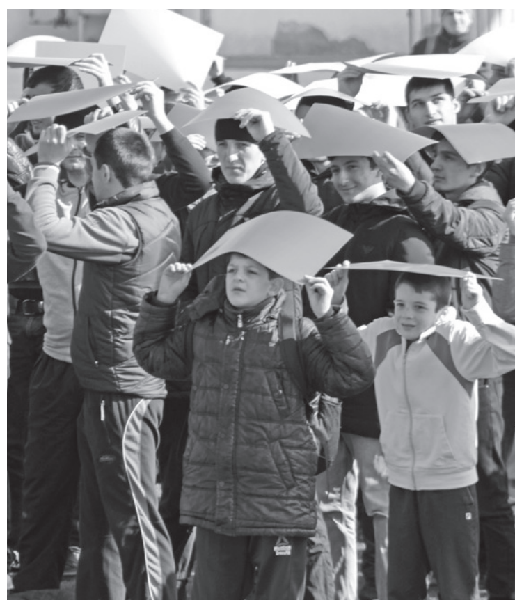
Акция завершилась флешмобом с российским флагом