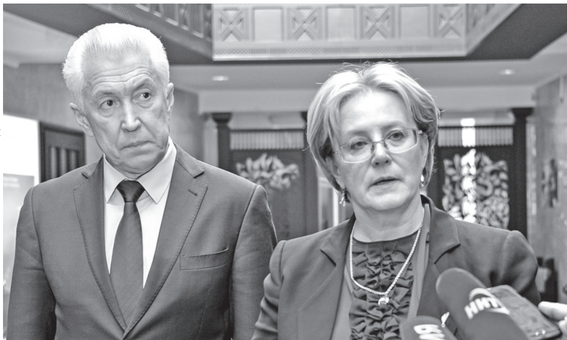
ПРЕСС-СЛУЖБА ГЛАВЫ И ПРАВИТЕЛЬСТВА РД

Глава Минздрава России высоко оценила здравоохранение в Дагестане