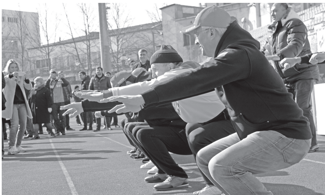
Три-четыре, закончили упражнение