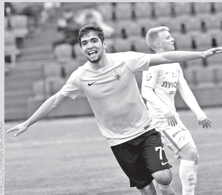
ПРЕСС-СЛУЖБА ФК «АНЖИ»

премьер-лиги, как минимум на год оставил своих резервистов без молодежного первенства. Играть молодежь